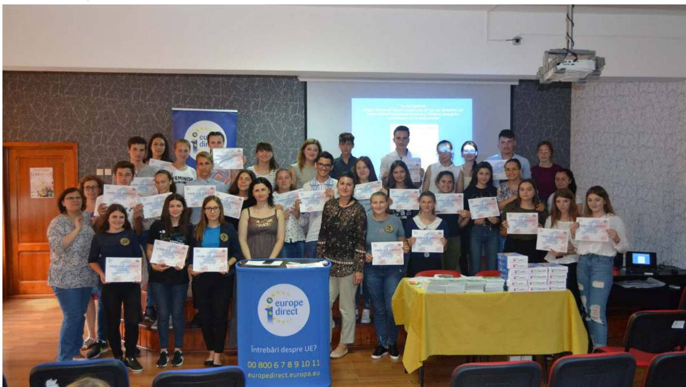
Campania Europa ta, drepturile tale , a Centrului de Informare Europe Direct Iași, la Colegiul CF "Unirea" Pașcani